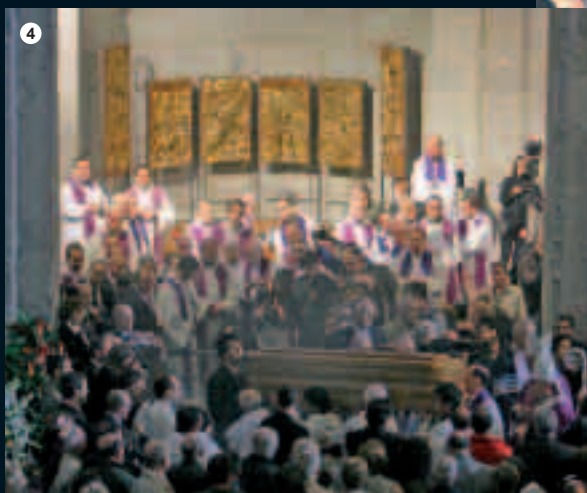
El fèretre amb les despulles de Mons. Joan Martí va ser dut en processó des del Palau Episcopal i a través del claustre de la Catedral de Santa Maria d'Urgell fins al peu de l'altar. Un cop acabada l'Eucaristia, el fèretre va ser devallat fins a la cripta del temple, on Mons. Martí reposa al costat dels Bisbes que el van precedir en el pontificat a la Diòcesi d'Urgell.