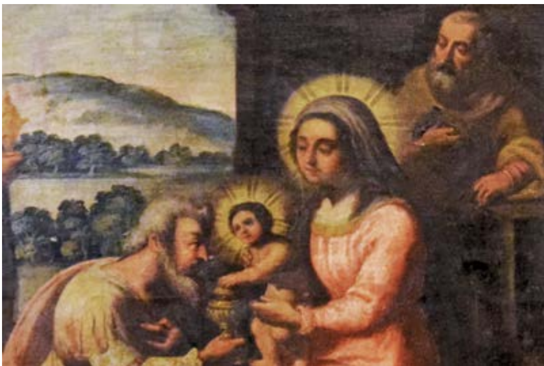
Fragment del retaule del s. XVIII de Sant Martí de La Cortinada (Ordino - Principat d'Andorra)

«Per amor, Déu ens destinà a ser fills seus per Jesucrist, segons la seva benèvola decisió, que dona lloança a la grandesa dels favors que ens ha concedit en el seu Estimat.»