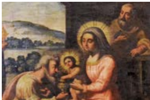
Fragmento del retablo del s. XVIII de Sant Martí de La Cortinada (Ordino - Principat d'Andorra)

«Por amor, Dios nos ha destinado por medio de Jesucristo, según el beneplácito de su voluntad, a ser sus hijos, para alabanza de la gloria de su gracia, que tan generosamente nos ha concedido en el Amado.»