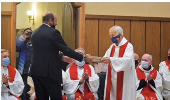
Homenatge a Mn. Pau Vidal

Després, les autoritats, juntament amb Mons. Vives, van fer la tradicional baixada, acompanyats del poble fidel, fins a la Plaça Mercadal i a l'Ajuntament de la ciutat, per cloure la festa de celebració.