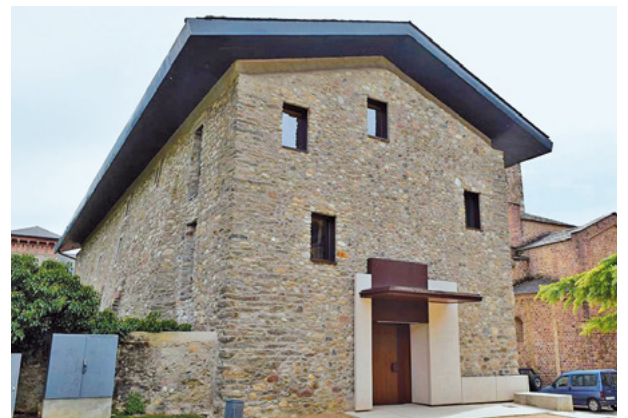
Nova seu dels arxius del Bisbat d'Urgell