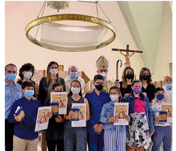
Confirmacions a Tèrmens