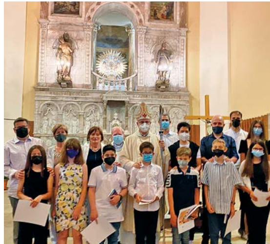
Confirmacions a Bellvís