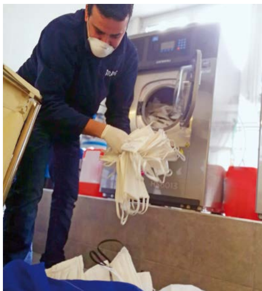
Es van higienitzar milers de mascaretes artesanals de manera gratuïta durant el confinament

Venda de roba a l'engrós: 376.682 kg, generant un estalvi a la Seguretat Social de 52.703,59 €. Hem generat 39.128,75 € d'IVA. Hem evitat taxes d'abocament a les administracions locals per valor de 26.367,74 €. Hem donat una segona vida útil a 113.727 kg de roba.