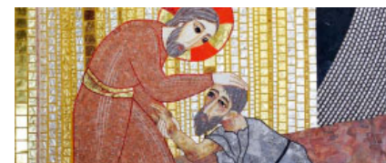
Curació del leprós (2009), de Marko Rupnik. Cripta del santuari de Sant Pius de Pietrelcina (Itàlia)

L'Evangelí d'avui ens narra la guarició d'un leprós, una malaltia molt greu: per una banda, per la naturalesa mateixa d'aquest mal que provoca instintivament el rebuig; després, perquè calia que el leprós visqués separat de tota la seva família; i en tercer lloc, perquè, hom suposava que el leprós, com tot malalt, era també un pecador, un impur. Podem imaginar-nos, doncs, la situació tan dura dels leprosos en el poble d'Israel. Ho explicita clarament la primera lectura: Els qui pateixen del mal de la lepra han d'anar escabellats, amb els vestits esquinçats, tapats fins a la boca i han de cridar: «Impur, impur». Mentre el mal persisteixi són impurs, i han de viure sols, fora del campament. Ens podem fer idea del que era patir del mal de lepra.