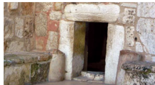
Entrada de la basílica de la Nativitat, Betlem

A quests personatges no són del poble d'Israel. Representen tots els pobles del món i la seva presència ens parla de la universalitat de la salvació que Jesús ens porta.