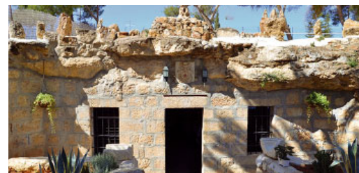
La cova dels pastors a Betlehem