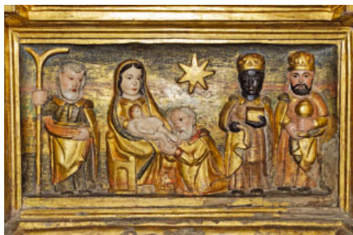
Fragmento del retablo del siglo XVII de la Virgen del Rosario. Encamp (Principado de Andorra)

«Las tinieblas cubren la tierra, la oscuridad los pueblos pero sobre ti amanecerá el Señor y su gloria se verá sobre ti. Caminarán los pueblos a tu luz, los reyes al resplandor de tu aurora.»