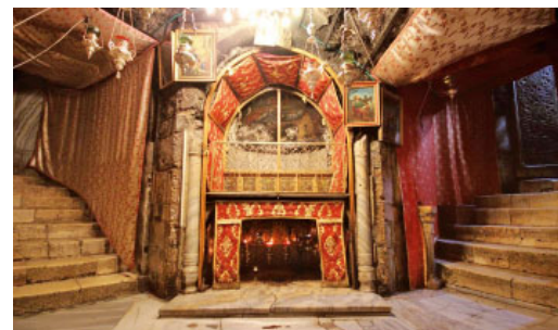
Basilica de la Nativitat, Betlem

E ls evangelis, els Sants Pares i la Litúrgia de l'Església ens parlen amplament de Josep i Maria, un matrimoni que vivia a Natzaret.