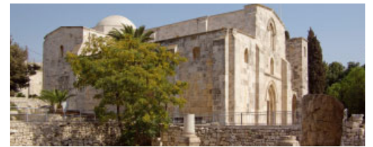
Església de Santa Anna a Jerusalem

D e Joaquim i Anna no ens en parla l'Evangelí. En tenim notícia per dues obres del segle II, els evangelis apòcrifs: El protoevangelí de Jaume i la Nativitat de Maria.