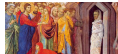
La resurrecció de Llätzer (1310) de Duccio di Buoninsegna. Museu d'Art Kimbell, Fort Worth, Texas (EUA)

Tots coneixem la dita: Tot té solució menys la mort. Per això no ens pot estranyar que els miracles de resurrecció cridin tant l'atenció: Molts dels jueus que havien vingut a casa de Maria i veieren el que va fer Jesús, cregueren en ell. Jesús acaba de ressuscitar Llätzer. Però creure en una resurrecció ara i aquí és difícil. Per això a l'afirmació de Jesús: El teu germà ressuscitarà , Marta diu: Ja sé que ressuscitarà quan tothom ressusciti el darrer dia. Tanmateix, Jesús cridà fort: Llätzer, vine a fora. I el mort sortí. Així d'aquesta forma tan senzilla ens sems que extraordinària Jesús torna a la vida el seu amic Llätzer. Així es fa realitat la primera lectura: Jo obriré els vostres sepulcres, us en faré sortir i us faré entrar en el territori d'Israel. Fa referència també a la fe: Quan obriré els vostres sepulcres i us en faré sortir, sabreu que jo soc el Senyor. Us infondré el meu esperit i recobrareu la vida. Llavors sabreu que jo, el Senyor, ho he anunciat i ho he complert.