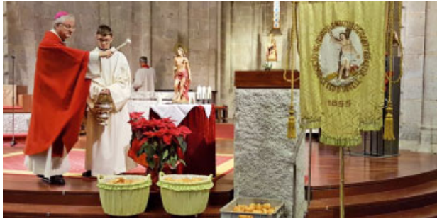
Celebració de Sant Sebastià a la Catedral de Santa Maria