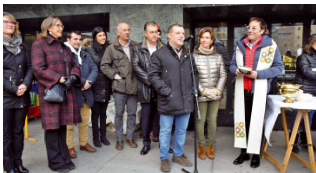
Celebració de Sant Sebastià a Sant Julià de Lòria