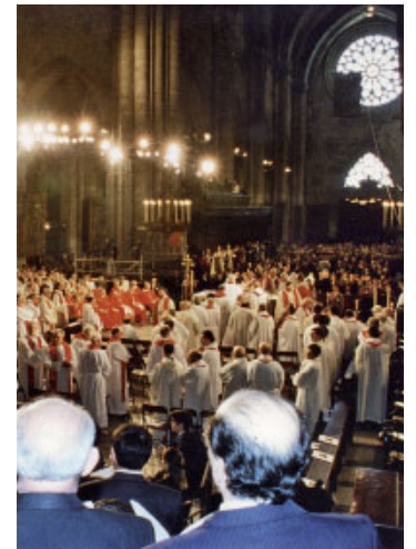
Inauguració del Concili Provincial Tarraconense, any 1995

Una experiència marcada pel guiatge de l'Esperit