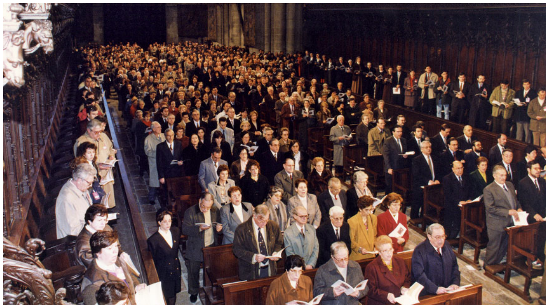
Imatge de la inauguració del Concili Provincial Tarraconense que va tenir lloc el 21 de gener de 1995, a la Catedral Basílica Metropolitana i Primada de Santa Tecla