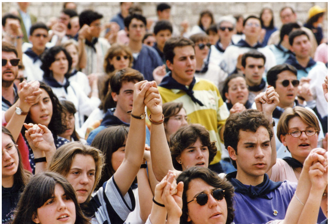
Un grup de joves participa a l'acte de cloenda del Concili Provincial Tarraconense, celebrat el 4 de juny de 1995

Contemplant els seus documents i resolucions, hom s'adona de la seva profunda actualitat. A la llum de l'Evangelí i de l'escolta de la Paraula de Déu, anunciar l'Evangelí a la nostra societat, amb una sol·licitud especial pels pobres, i en un marc d'unitat pastoral de les nostres Esglésies, ha de ser el pernil o el pal de paeller de l'Església d'avui. Per aquest motiu, ens trobem en plena fase de recepció del Concili Provincial de 1995. Amb les degudes condicions d'universalitat de temps i d'espai, la recepció ha d'anar originant un veritable «consensus fidelium»,