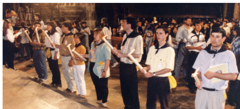
Moment de la cloenda del Concili a l'interior de la Catedral de Tarragona