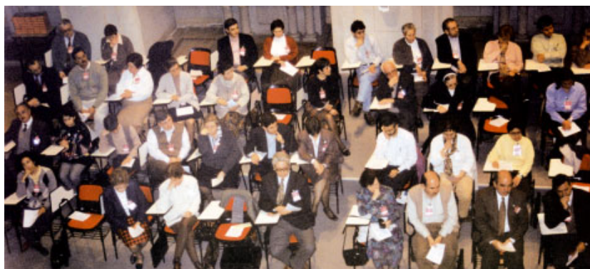
Sessions de treball al Casal Borja de Sant Cugat del Vallès