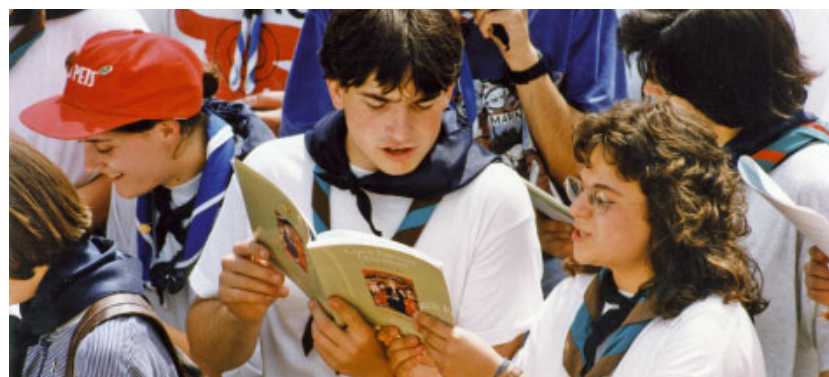
Joves participant en l'acte de cloenda del Concili a l'amfiteatre romà de Tarragona el dia 4 de juny de 1995