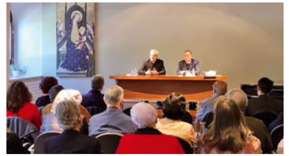
Els animadors a La Seu d'Urgell

E ls animadors de la Litúrgia de la Diòcesi d'Urgell van celebrar l'11a Trobada formativa el dissabte dia 25 de maig al Santuari del Sant Crist de Balaguer. Hi van participar una trentena de participants. Obrí la sessió l'Arquebisbe d'Urgell que valorà molt aquesta continuïtat de la trobada des de fa onze anys, i que es pugui fer doble, ja que dissabte dia 1 de juny es va celebrar una segona sessió de la mateixa formació a La Seu d'Urgell,