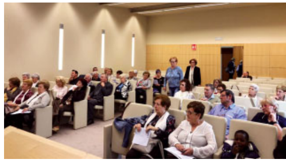
Celebració de la trobada a Balaguer