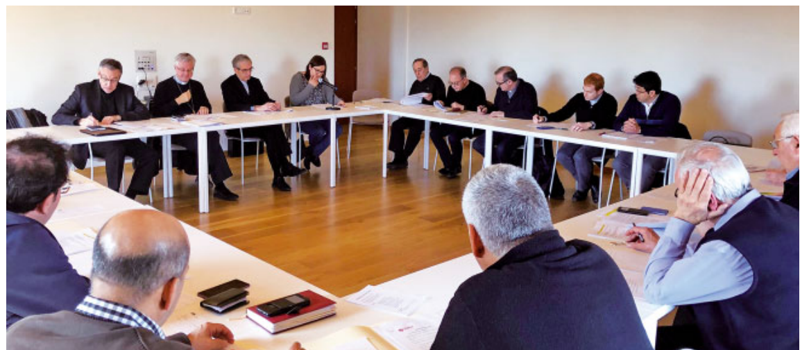
Reunió del Consell del Presbiteri

A continuació, va informar als Consellers sobre la creació d'un Centre Especial de Treball (CET) a par-