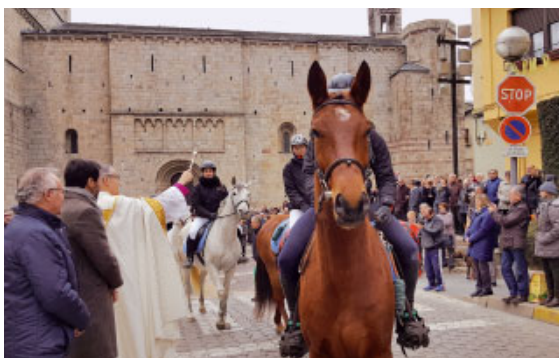
Inici dels Tres Tombs