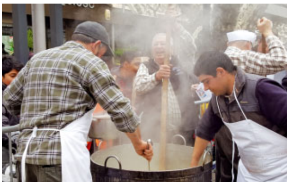
Escudellaires preparant l'escudella