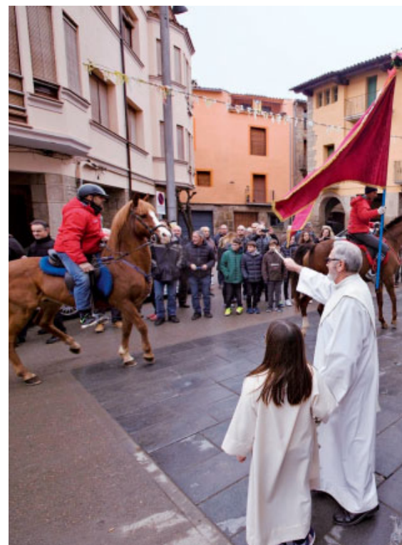
Festa de Sant Antoni Abat a Sanauja

La festa de Sant Antoni Abat es va celebrar arreu de la Diòcesi d'Urgell amb intensitat el dia 17 de gener. A moltes parròquies van celebrar-se misses amb la presència de fidels i devots de Sant Antoni Abat. També van tenir lloc benediccions d'animals de companyia i bestiar, escudelles, etc.