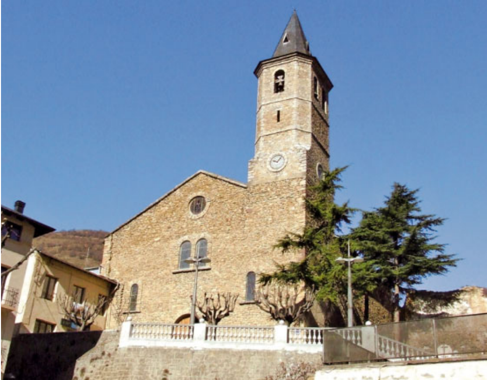
Façana de llevant de Sant Feliu de Sort

L'Escola Pia de Catalunya va organitzar, el diumenge 4 de març, una activitat escolàpia, històrica, espiritual i solidària que va voler donar a conèixer un recorregut que uneix els diferents punts lligats a la vida de Sant Josep Calassanç i que va servir per acostar-se més a la figura del fundador de l'Escola Pia.