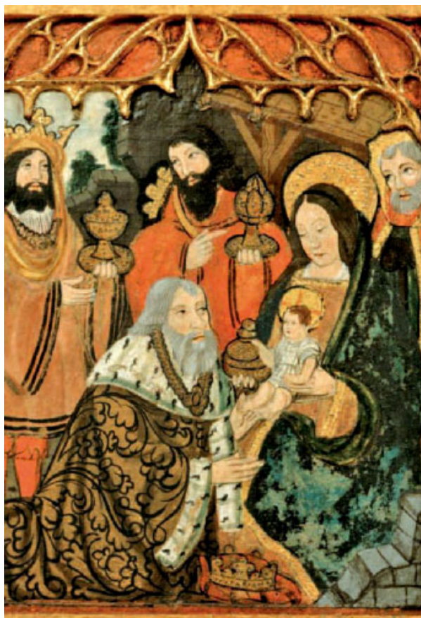
Retaule dels Goigs de la Verge de Cornellana, Vall de la Vansa (segle XVI)

«Venim a presentar al Senyor el nostre homenatge» Anem decididament a l'encontre del Senyor, per oferir-li el nostre homenatge, ple d'amor; per oferir-nos nosaltres mateixos, millor que coses, or, encens o mirra... Ell espera les nostres vides. Ho espera tot!