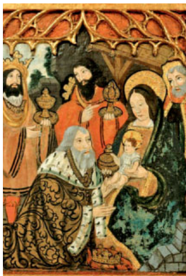
Retablo de los Gozos de la Virgen de Cornellana, Valle de la Vansa (siglo XVI)

E s Navidad! El Señor nos viene a visitar, un año más. Trae consigo todos los dones de la divinidad para unirlos a nuestra humanidad caída y débil, y redimirla, así, con su inmensa misericordia, y elevarla hasta la inmortalidad. ¡Jesús, el Salvador, es nuestra esperanza! Todos podemos acercarnos a Él para sentir el calor de su amor y su perdón que nos curan y nos llenan de luz.