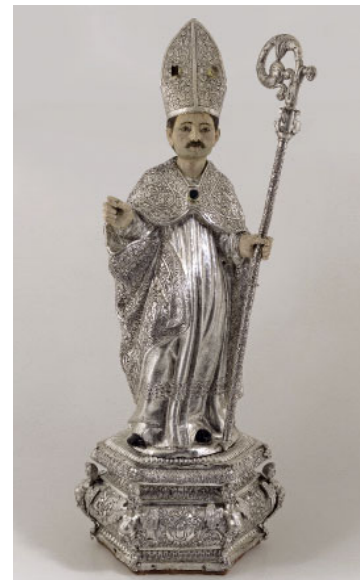
Escultura de Sant Ot (s. XVII)