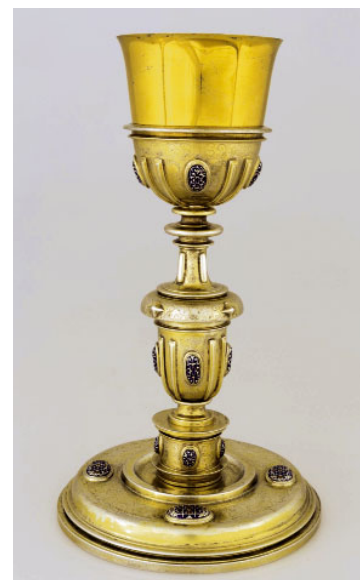
Calze (s. XIX)

jades curosament de la pols i la brutícia, i sotmeses a un tractament d'ultrasons o de neteja