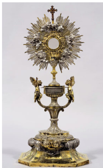
Custòdia del Bisbe Benlloch (s. XVII-XIX)