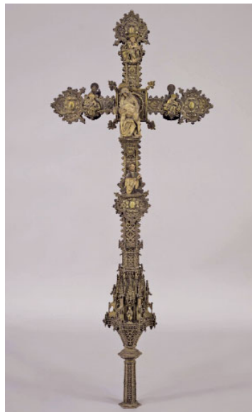
Creu processional de la Pietat (s. XVI)

Les peces que contenen fusta han estat netejades de possibles insectes xilòfags, les de metall han estat desmuntades i nete-