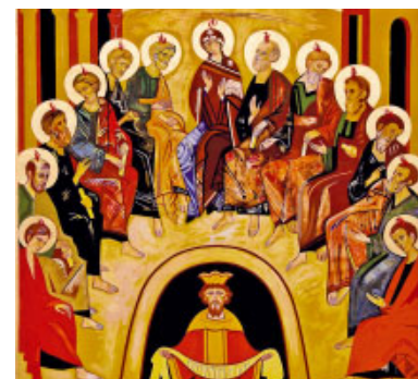
Corona Misterica, Pentecosta (2004), de Kiko Argüello. Catedral de l'Almudena de Madrid

Els jueus a Pentecosta donaven gràcies a Déu: primer pel do de la collita i des del s. II aC pel gran do de l'Aliança.