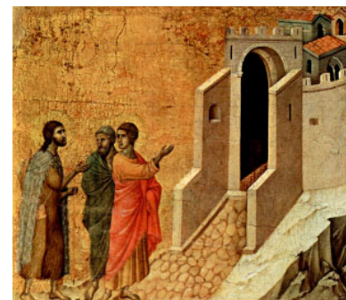
Camí d'Emaús. Maestà (1308-1311) de Duccio di Buoninsegna. Museo dell'Opera del Duomo (Siena, Itàlia)

El discurs de missió de Pere als jueus és la primera proclamació eclesial de la Resurrecció de Jesús que vosaltres vau matar fent-lo clavar a la creu i Déu l'ha ressuscitat . La culpabilitat és clau per cridar al penediment i a la conversió.