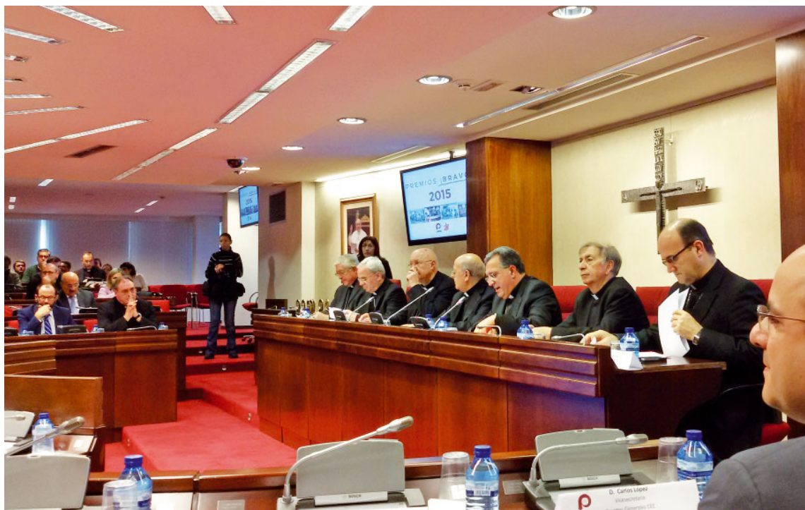
Lliurament de premis ¡Bravo! l'any 2016

El Jurat designat per la Comissió Episcopal de Mitjans de Comunicació Social (CEMCS) lliurà els premis ¡Bravo! d'enguany el proper dia 25 de gener a Madrid.