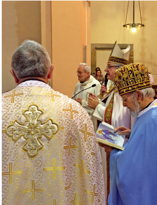
Benedicció d'una imatge de la comunitat greco-catòlica a Guissona

Amb la mirada posada en el tema d'enguany i la Reforma luterana que es va dur a terme a Alemanya iniciada amb la publicació de les tesis de Martí Luter el 1517, les parròquies de la diòcesi han fet en la darrera setmana, com