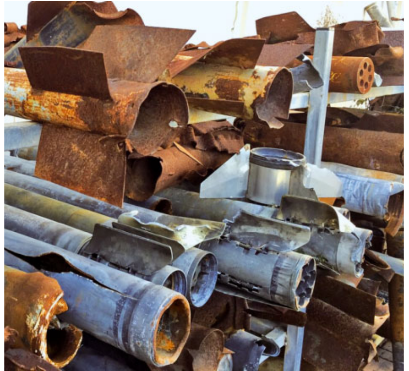
Restes d'armament llençat en la zona de Betlem

Per això, cal obrir-se al Senyor: «qui acull la Bona Notícia de Jesús reconeix la seva pròpia violència i es dei-