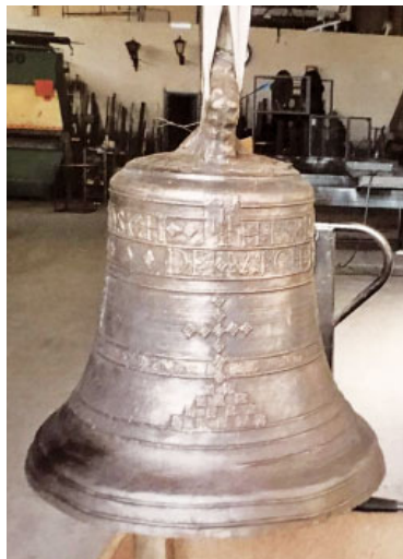
La campana abans i després de la seva restauració

El rellotge s'ha disposat per què les campanes toquin les hores i aquesta sigui la dels quarts i la dels avisos d'incendis.