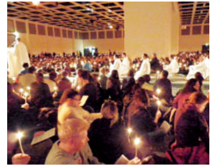
Pregària a Berlín

rents horaris. El programa d'activitats previstes es pot consultar al web creat per a l'esdeveniment, www.taizevalencia.es així com diversos vídeos de motivació.