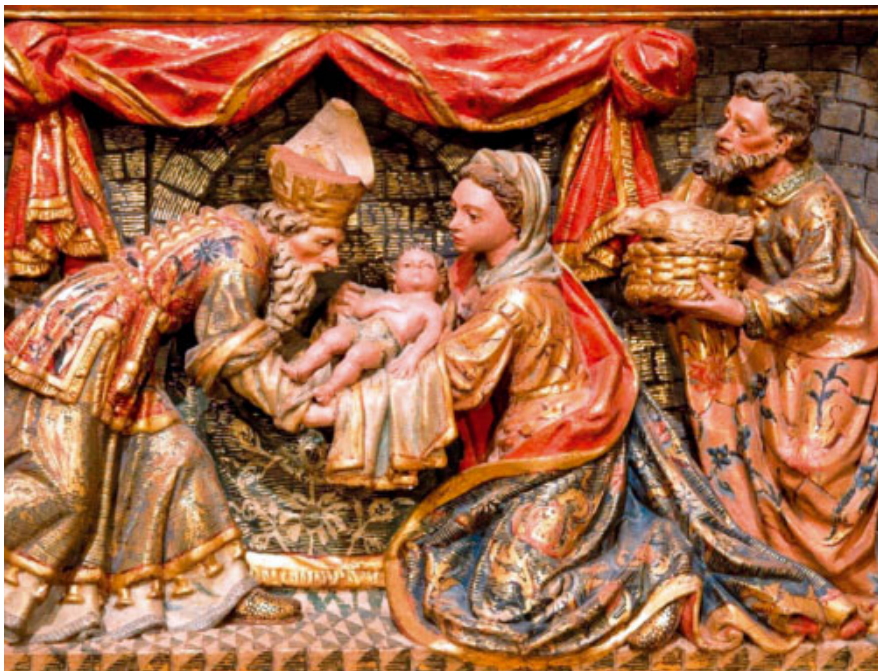
Fragment del retaule de la Mare de Déu del Roser de Ponts (segle XVII)

«Posem davant els ulls de la ment la icona de Maria Mare que va amb el Nen Jesús en braços. El porta al Temple, el porta al poble, el porta a trobar-se amb el seu poble. Els braços de la seva Mare són com l'«escala» per la qual el Fill de Déu baixa fins a nosaltres, l'escala de la condescendència de Déu.