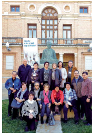
Ajudar a fer el salt cap al Misteri ha estat el lema d'aquestencontre formatiu. En la seva encicli-