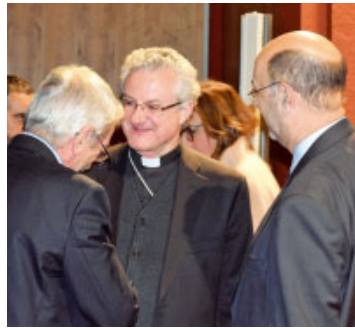
Mons. Joan-Enric Vives va parlar de la necessària innovació a la que obliga el rit-