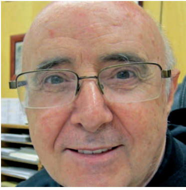
Aquesta imatge parla