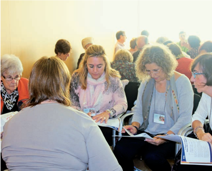
Els catequistes a la darrera jornada de formació a Andorra

Per als catequistes, és una tasca feta amb el cor i els cinc sentits, que els permet copsar les inquietuds dels infants i apropiarse de manera familiar amb un regal: el de la Fe en Crist.