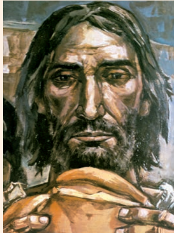
Rostre de Crist en la Santa Cena. Fragment d'una pintura, obra de José Vela Zanetti

En aquel tiempo, cuando la gente vio que ni Jesús ni sus discípulos estaban allí, se embarcaron y fueron a Cafarnaún en busca de Jesús. Al encontrarlo en la otra orilla del lago, le preguntaron: «Maestro, ¿cuándo has venido aquí?» Jesús contestó: «Os lo aseguro: me buscáis no porque habéis visto signos, sino porque comisteis pan hasta saciaros. Trabajad no por el alimento que perece, sino por el alimento que perdura para la vida eterna, el que os dará el Hijo del hombre; pues a éste lo ha sellado el Padre, Dios.» Ellos le preguntaron: «Y, ¿qué obras tenemos que hacer para trabajar en lo que Dios quiere?» Respondió Jesús: «La obra que Dios quiere es ésta: que creáis en el que él ha enviado.» Le replicaron: «¿Y qué signo vemos que haces tú, para que creamos en ti? ¿Cuál es tu obra? Nuestros padres comieron el maná en el desierto, como está escrito: "Les dio a comer pan del cielo."» Jesús les replicó: «Os aseguro que no fue Moisés quien os dio pan del cielo, sino que es mi Padre el que os da el verdadero pan del cielo. Porque el pan de Dios es el que baja del cielo y da vida al mundo.» Entonces le dijeron: «Señor, danos siempre de este pan.» Jesús les contestó: «Yo soy el pan de vida. El que viene a mí no pasará hambre, y el que cree en mí nunca pasará sed.»