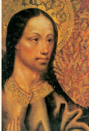
Faç de Crist. Pintura sobre taula de l'anomenat Mestre de Robredo, Museu del Prado (Madrid)

En aquel tiempo, los apóstoles volvieron a reunirse con Jesús y le contaron todo lo que habían hecho y enseñado. Él les dijo: «Venid vosotros solos a un sitio tranquilo a descansar un poco.» Porque eran tantos los que iban y venían que no encontraban tiempo ni para comer. Se fueron en barca a un sitio tranquilo y apartado. Muchos los vieron marcharse y los reconocieron; entonces de todas las aldeas fueron corriendo por tierra a aquel sitio y se les adelantaron. Al desembarcar, Jesús vio una multitud y le dio lástima de ellos, porque andaban como ovejas sin pastor; y se puso a enseñarles con calma.