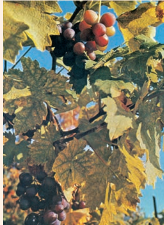
«Qui està en mi i jo en ell dóna molt de fruit», diu el Senyor

Serà per a ell la vida que em dóna, / els meus descendents li seran fidels. / Parlaran del Senyor a les generacions que vindran, / i anunciaran els seus favors als qui naixeran després, / i els diran: «El Senyor ha fet tot això.» R.