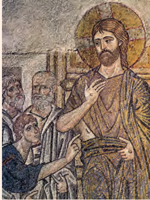
Crist respon a la incredulitat de Tomàs. Mosaic del segle XI (fragment), Monestir de Dafni (Grècia)

Ninguno pasaba necesidad, pues los que poseían tierras o casas las vendían, traían el dinero y lo ponían a disposición de los apóstoles; luego se distribuía según lo que necesitaba cada uno.