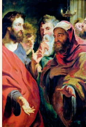
Jesús conversa amb Nicodem. Pintura de Jacob Jordaens (1593-1678), Museu de Belles Arts de Tournai (Bèlgica)

R. Que se me pegue la lengua al paladar si no me acuerdo de ti. Junto a los canales de Babilonia / nos sentamos a llorar con nostalgia de Sió; / en los sauces de sus orillas / colgábamos nuestras cítaras. R. Allí los que nos deportaron nos invitaban a cantar; / nuestros opresores, a divertirlos: / «Cantadnos un cantar de Sió.» R. ¿Cómo cantar un cántico del Señor / en tierra extranjera! / Si me olvido de ti, Jerusalén, / que se me paralice la mano derecha. R. Que se me pegue la lengua al paladar / si no me acuerdo de ti, / si no pongo a Jerusalén / en la cumbre de mis alegrías. R.