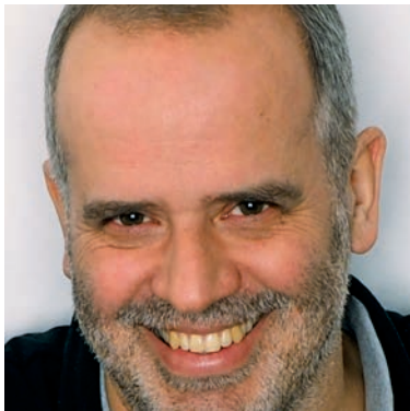
► ÉDITION FAÑANÁS LANAU