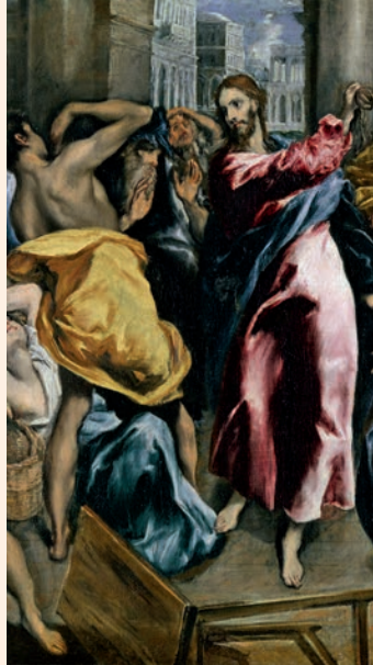
L'expulsió dels mercaders del temple. Pintura d'El Greco (fragment), església de San Ginés (Madrid)

Los judíos exigen signos, los griegos buscan sabiduría; pero nosotros predicamos a Cristo crucificado: escándalo para los judíos, necedad para los gentiles; pero, para los llamados —judíos o griegos—, un Mesías que es fuerza de Dios y sabiduría de Dios. Pues lo necio de Dios es más sabio que los hombres; y lo débil de Dios es más fuerte que los hombres.