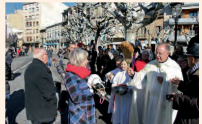
Sant Antoni a Tremp