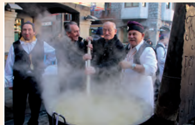
Sant Antoni a Andorra