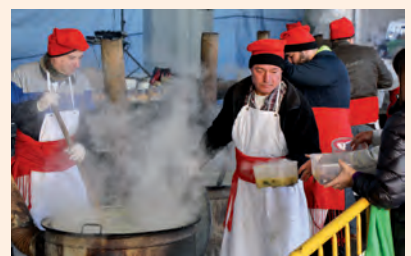
Sant Antoni a Escaldes