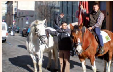
Sant Antoni a La Seu d'Urgell

La festa de Sant Antoni Abat, de gran tradició i arrelament al nostre bisbat, s'ha celebrat enguany de manera especialment festiva en coincidir la diada amb el dissabte. Els rectors de moltes parròquies han fet les benediccions dels animals de companyia i s'ha celebrat la processó dels Tres Tombs amb guarniment. De Puigcerdà a La Seu d'Urgell, Sanaüja, Ponts, Tremp, Vielha, Canillo, Andorra la Vella... indrets molt diversos units sota el signe de la devoció a Sant Antoni i la solidaritat, que es materialitza en la confecció de les tradicionals olles d'escudella. Germandats i associacions van treballar en comunió per confeccionar les escudelles que es reparteixen entre els veïns, recordant el gest de solidaritat de compartir un plat calent i abundós, ple de calories en el fred hivern. Per exemple, la Confraria d'Escudellaires d'Andorra la Vella, va repartir unes 3.000 racions de vianda.