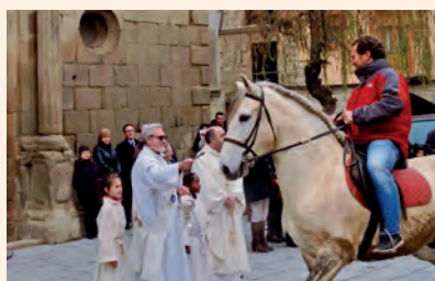
Sant Antoni a Sanaüja