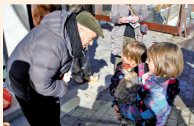
Benedicció a Canillo