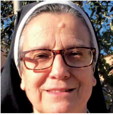
Aquesta imatge parla