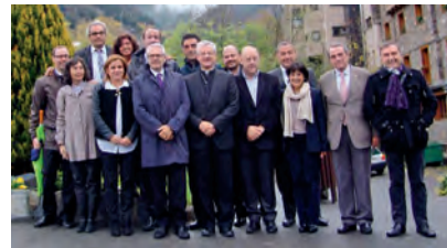
Mons. Vives amb els cònsols majors i menors d'Andorra

Al Saló de Plens del Comú i amb la presència de tots els Hbles. Srs. Consellers de Comú, el Cònsol Major adreçà unes paraules de benvinguda, recordant la llarga tradició