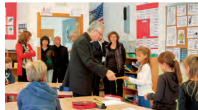
A l'escola andorrana de primària els infants li van fer obsequi d'un record fet per ells