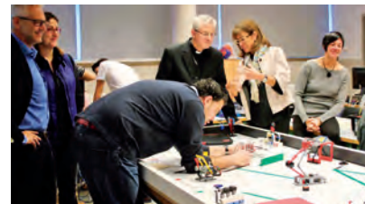
A l'escola andorrana de secundària coneugué projectes com les classes de robòtica