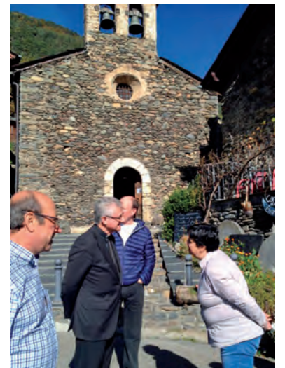
La visita es va anar desgranant pels quarts de la parròquia, com Llorens

tot exhortant els fidels a no renunciar a les seves arrels i a la seva identitat, i a mantenir la fidelitat als Coprínceps i a la història mil·lenària d'Andorra.