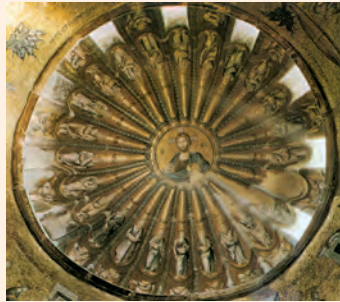
Tots els temps convergeixen en Crist. Cúpula de la famosa Kariye Djami d'Is-tanbul (Turquia)

Que la vostra mà reposi / sobre l'home que serà el vostre braç dret, / el fill de l'home a qui vos doneu la força. / No ens apartarem mai més de vos; / guardeu-nos vos la vida / perquè invoquem el vostre nom. R.