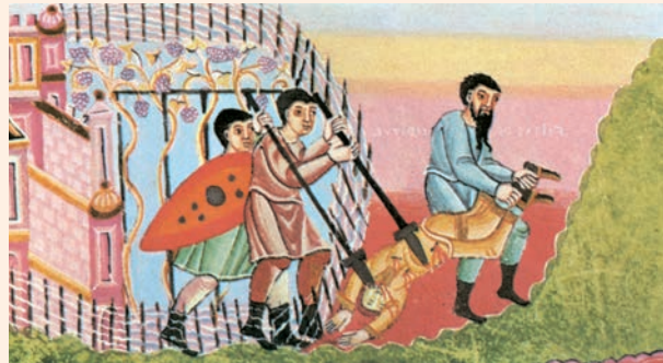
Paràbola dels vinyaters homicides. Evangeliari d'Echternach, Museu Nacional de Nüremberg

En aquel tiempo, dijo Jesús a los sumos sacerdotes y a los senadores del pueblo: «Escuchad otra parábola: Había un propietario que plantó una viña, la rodeó con una cerca, cavó en ella un lagar, construyó la casa del guarda, la arrendó a unos labradores y se marchó de viaje. Llegado el tiempo de la vendimia, envió sus criados a los labradores, para percibir los frutos que le correspondían. Pero los labradores, agarrando a los criados, apalearon a uno, mataron a otro, y a otro lo apedrearon. Envío de nuevo otros criados, más que la primera vez, e hicieron con ellos lo mismo. Por último les mandó a su hijo, diciéndose: «Tendrán respeto a mi hijo.» Pero los labradores, al ver al hijo, se dijeron: «Este es el heredero: venid, lo matamos y nos quedamos con su herencia.» Y, agarrándolo, lo empujaron fuera de la viña y lo mataron. Y ahora, cuando vuelva el dueño de la viña, ¿qué hará con aquellos labradores?» Le contestaron: «Hará morir de mala muerte a esos malvados y arrendará la viña a otros labradores, que le entreguen los frutos a sus tiempos.» Y Jesús les dice: «¿No habéis leído nunca en la Escritura: «La piedra que desecharon los arquitectos es ahora la piedra angular. Es el Señor quien lo ha hecho, ha sido un milagro patente»? Por eso os digo que se os quitará a vosotros el reino de Dios y se dará a un pueblo que produzca sus frutos.»