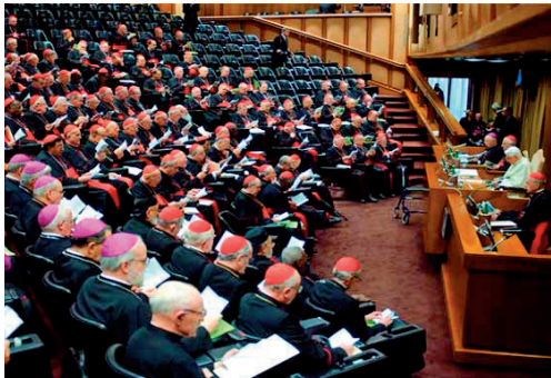
Reunió plenària del Sínode sobre la Nova Evangelització (2012)

la paraula els pares sinodals i el mateix papa Francesc. Que l'Esperit Sant els il·lumini.