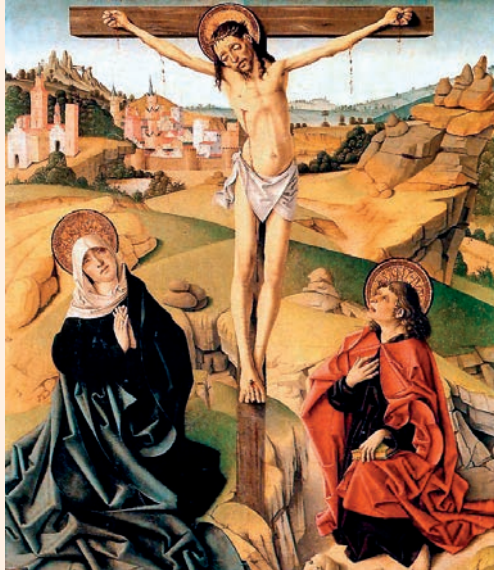
El Calvari. Pintura de Francisco Gallego (1468?-1507)

Ell, tot amor entranyable, / els perdonava la culpa i la vida, / refrenava tothora el seu rigor, / s'aguantava per no ésser sever. R.