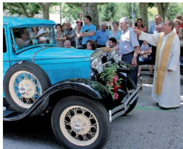
Benedicció a La Seu d'Urgell

Altres parròquies també ho van fer diumenge o bé el dijous 10 de juliol, la diada del sant. Així va passar per exemple a diverses parròquies d'Andorra. Els sacerdots van explicar la importància de crear consciència de la responsabilitat que cal tenir al volant, i de la necessitat de prevenir els accidents de circulació. Durant les benediccions es van repartir clauers de Sant Cristòfol als conductors que van fer donatius. Els donatius es van fer arribar a Càritas, les Cases de colònies per infants amb dificultats.