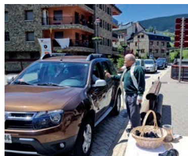
Benedicció a Canillo