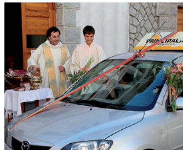
Benedicció a Sant Julià