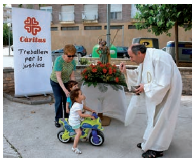
Benedicció a Ponts