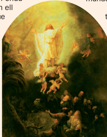
Ascensió del Senyor. Pintura de Rembrandt, Alte Pinakothek, Munic (Alemanya)

Que és rei de tot el món, / canteu a Déu un himne. / Déu regna sobre les nacions, / Déu seu al tron sagrat. R.