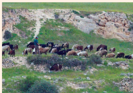
Pastor a la Vall de Cremisan

Després de l'assentament a la terra de Canaan, quan part del poble vivia en poblacions i cultivava la terra, sorgiren algunes tensions entre pagesos i pastors. Cadascuna de les dues activitats era addicta a una realitat ideològica i social. Mentre el pastor mantenia els principis ideològics i religiosos, i feia la feina amb la rutina de sempre, el qui vivia de l'agricultura assajava canvis, no solament instrumentals amb eines noves per cultivar la terra,