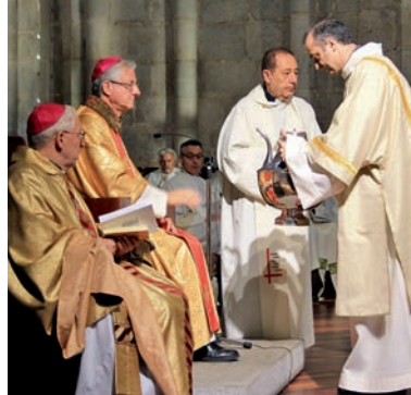
Benedicció de l'Oli dels Malalts i dels Catecúmens