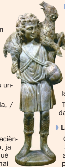
Crist, Bon Pastor. Escultura de finals del s. III, Museu de les Termes (Roma)

Jesús les puso esta comparación, pero ellos no entendieron de qué les hablaba. Por eso añadió Jesús: «Os aseguro que yo soy la puerta de las ovejas. Todos los que han venido antes de mí son ladrones y bandidos; pero las ovejas no los escucharon. Yo soy la puerta: quien entre por mí se salvará y podrá entrar y salir, y encontrará pastos. El ladrón no entra sino para robar y matar y hacer estrago; yo he venido para que tengan vida y la tengan abundante.»