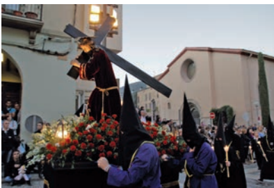
Processó a La Seu d'Urgell