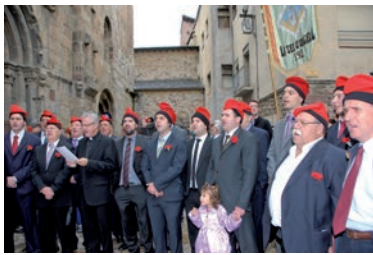
Caramelles a La Seu

ces i començar a viure-les amb novetat de vida, per la força de l'Esperit Sant que ens ha estat donat.»