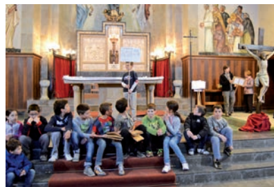
Via Crucis a Ponts