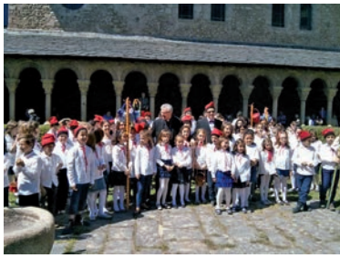
Caramelles al Claustre