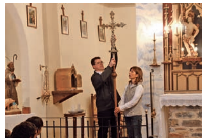
Setmana Santa a la Vall Fosca