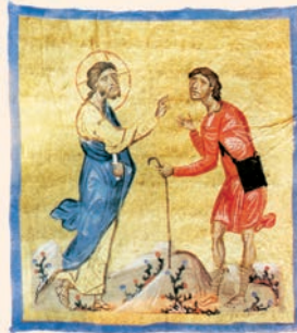
Jesús guareix un cec. Il·lustració d'un manuscrit bizantí

Tu bondad y tu misericordia me acompañan / todos los días de mi vida, / y habitaré en la casa del Señor / por años sin término. R.