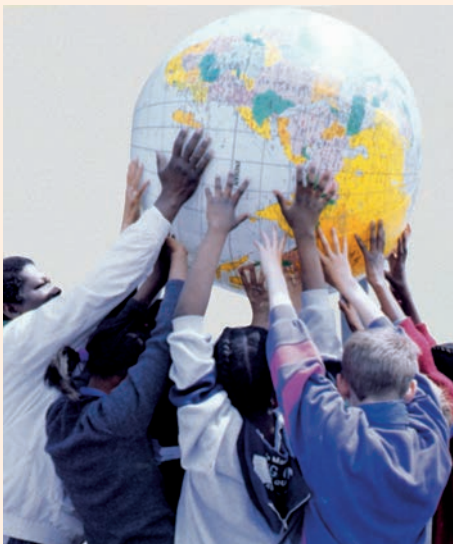
Els cristians, cridats a ser llum per les seves bones obres

Vosotros sois la luz del mundo. No se puede ocultar una ciudad puesta en lo alto de un monte. Tampoco se enciende una lámpara para meterla debajo del celemín, sino para ponerla en el candelero y que alumbré a todos los de casa. Alumbré así vuestra luz a los hombres, para que vean vuestras buenas obras y den gloria a vuestro Padre que está en el cielo.»