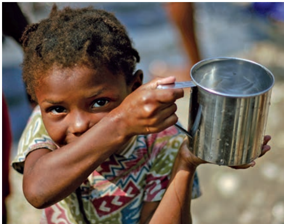
☺) Aquesta imatge parla

ròquies i centres de culte, permetrà posar en marxa centenars de projectes a països empobrits del Tercer Món.