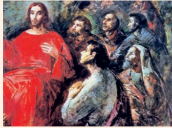
Jesús envoltat dels apòstols. Pintura de Consadori, Museu d'Art Modern de la Ciutat del Vaticà

N'estic cert, fruitaré en la vida eterna / de la bondat que em té el Senyor. / Espera en el Senyor! / Sigues valent! Que el teu cor no defalleixi. / Espera en el Senyor! R.