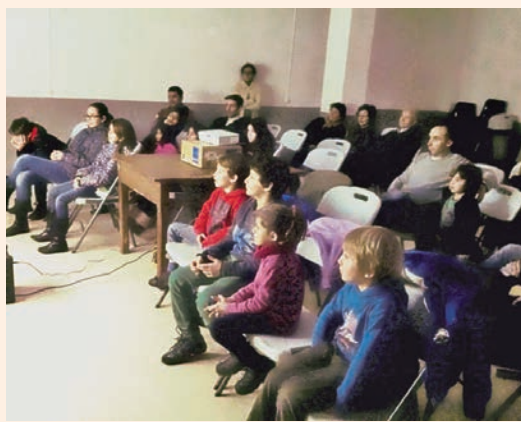
La projecció a la Vall Fosca va aplegar infants de diverses edats i els seus pares de pobles diferents de la Vall