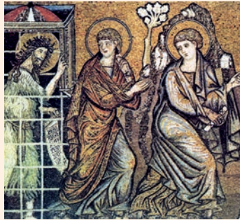
Joan Baptista envia els seus deixebles a Jesús. Mosaic del baptisteri de la catedral de Florència (s. XII)

Volverán los rescatados del Señor, vendrán a Sión con cánticos: en cabeza, alegría perpetua; siguiéndolos, gozo y alegría. Pena y aflicción se alejarán.