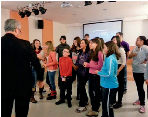
●) Aquesta imatge parla

les diferents escoles de la parròquia, en l'Andorrana d'Ensenyança Secundària, va ser rebut pel cor de l'escola, que va cantar algunes cançons. També va visitar les instal·lacions comunals, les esportives, parlà amb el consell de pastoral de la parròquia, visità els malalts i va recórrer les esglésies i ermites. També visità el Pas de la Casa.