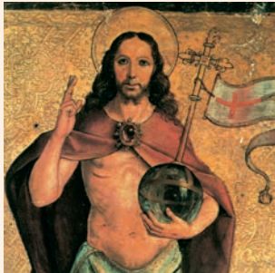
El Salvador. Pintura sobre taula, atribuïda a Pedro Berruguete. Museu Diocesà de Palència

»¿O qué rey, si va a dar la batalla a otro rey, no se sienta primero a deliberar si con diez mil hombres podrá salir al paso del que le ataca con veinte mil? Y si no, cuando el otro está todavía lejos, envía legados para pedir condiciones de paz. Lo mismo vosotros: el que no renuncia a todos sus bienes no puede ser discípulo mío.»