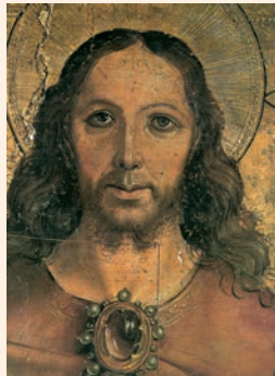
La faç de Crist, el Salvador. Pintura de Berruguete (fragment), Museu Diocesà de Palència

Derramaste en tu heredad, oh Dios, una lluvia copiosa, / aliviaste la tierra extenuada; / y tu rebaño habitó en la tierra / que tu bondad, oh Dios, preparó para los pobres. R.